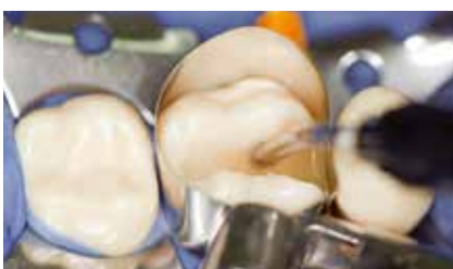
... und 4 Millimeter mit x-tra base füllen