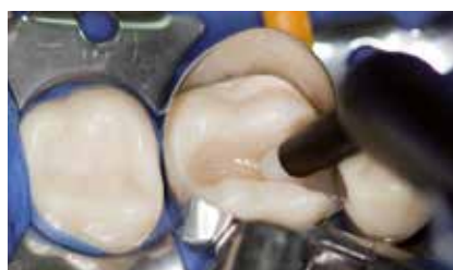
2 Millimeter Deckschicht GrandioSO einbringen