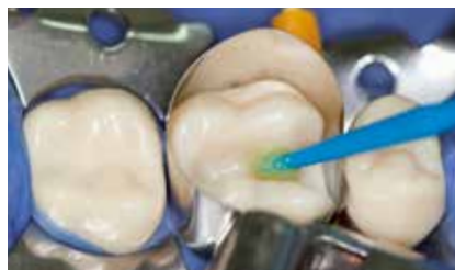
Benetzen der Kavitätenwände mit Futurabond DC