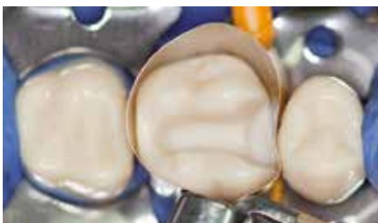
Fertig präparierte Kavität