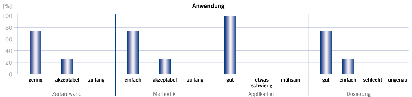
Ergebnisse der Befragung von Testzahnärzten

Profluorid Varnish ist ein zahnfarbener Lack, der die Ästhetik nicht beeinträchtigt. Erhältlich in den Geschmacksrichtungen: Bubble Gum und Kirsche insbesondere für Kinder und jüngere Patienten, Minze als klassischer Geschmack vor allem für Erwachsene, Karamell als cremige Variante, Melone und Pina Colada als exotische Geschmacksrichtungen und die fruchtig prickelnde Frische von Cola Lime. Mit diesen raffinierten Geschmacksrichtungen können Sie noch mehr Service bieten und individuell auf Ihren Patienten eingehen.