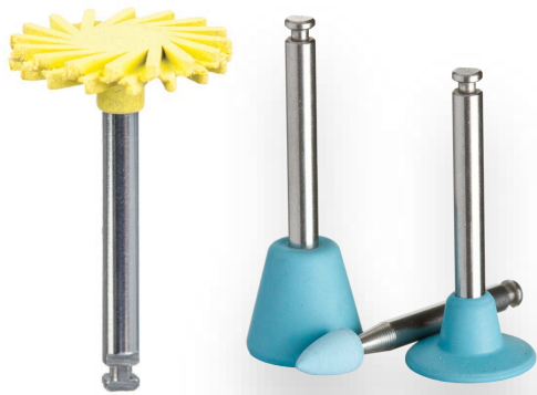
Polishing Cups, Points, Disks, etc.