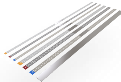
Strips and Saws