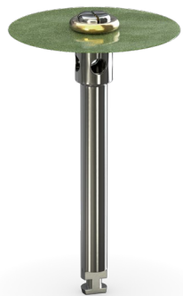
sehr grob Diamant