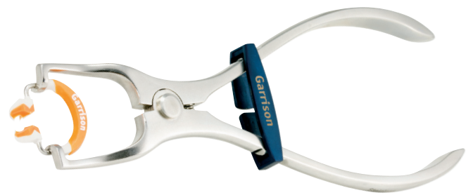
Composi-Tight® 3D Fusion™ Ringseparierzange Art.Nr. FXP01

Das Teilmatrizensystem für alle Klasse II Kavitäten