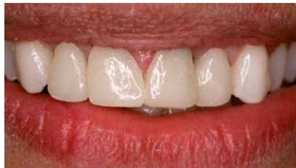
Nachher: Zahnähnlicher Glanz des Provisoriums ohne Hochglanzpolitur