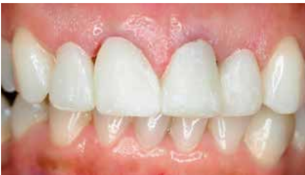
Vorher: Raue Oberfläche eines Frontzahnprovisoriums

hergestellt. Das Provisorium erhält zusätzlich einen Schutz vor Verfärbungen. Auch die Plaquebesiedlung auf dem Provisorium wird aufgrund der extrem glatten Oberfläche reduziert.