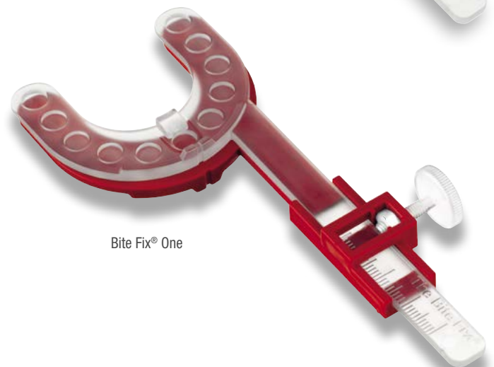
Bite Fix® One

Diese Eigenschaften haben unsere Bite Fix® Bissregistrierungen gemeinsam: