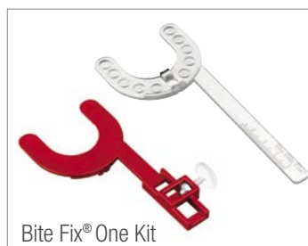
Bite Fix® One Kit

Bite Fix® One ist preisgünstig und anwenderfreundlich.