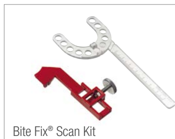
Bite Fix® Scan Kit

Und: Durch die integrierte Sollbruchstelle an der Bissgabel ist Bite Fix® Scan passend für jeden Scanner.