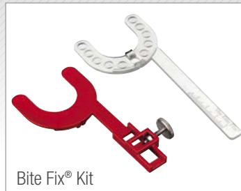
Bite Fix® Kit

Zudem ist die Bite Fix® Bissregistrierung aus sterilisierbarem Kunststoff, der Grundkörper (rot) ist mehrfach verwendbar.