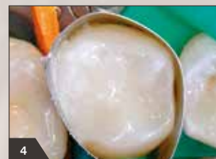
4 Endschichtung mit transluzenter Schmelzmasse