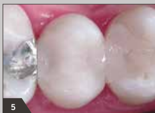
5 Fertige Restauration nach Endpolitur