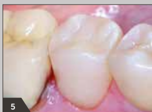
5 Ausgearbeitete und polierte Füllung von vestibulär