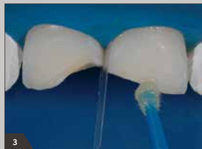
3 Applikation des Adhäsivs