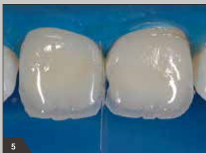
5 Modellieren des Dentins und der Mamelons mit Amaris O1