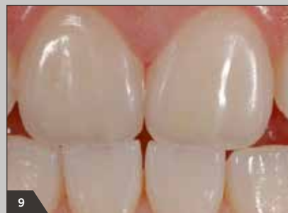
9 Fertige Frontzahnrestauration