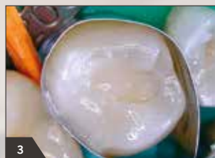
3 Schichtung in Inkrementen mit opaker Dentinmasse