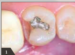
1 Frakturierte Amalgamfüllung okklusal-distal des Zahnes 45