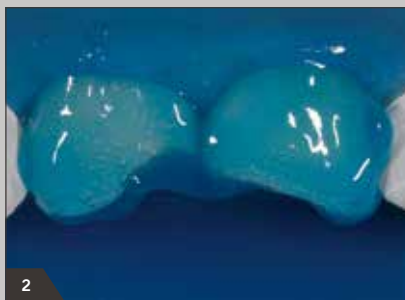
2 Konditionieren der Zahnhartsubstanz mit 37 %iger Phosphorsäure