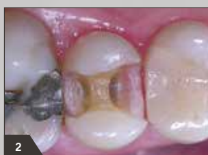
2 Situation nach Entfernung der Fül- lung sowie vollständiger Exkavation