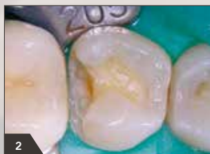
2 Kofferdam gelegt und restliche Amalgamfüllung entfernt. Situation nach vollständiger Exkavation