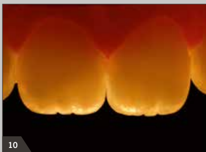
10 Natürliche Opaleszenz und Transluzenz der Füllungen