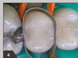
4 Finale Schichtung mit transluzenter Schmelzmasse