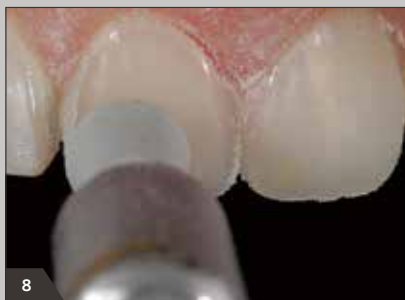
8 Hochglanzpolitur der Restauration