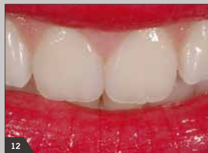
12 Naturidentische Restauration der Frontzähne