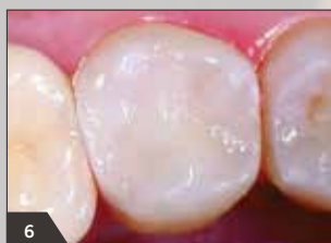
6 Fertige Restauration von okklusal