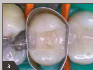
3 Schichtung mit Inkrementen aus opaker Dentinmasse