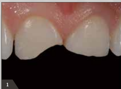
1 Ausgangssituation: Inzisalfraktur bei den Zähnen 11 und 21