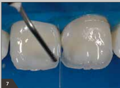
7 Gestaltung der inzisalen Kanten mit dem hochtransluzenten Amaris Flow HT