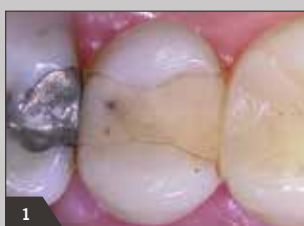
1 Insuffiziente Kunststofffüllung des Zahnes 25 mod