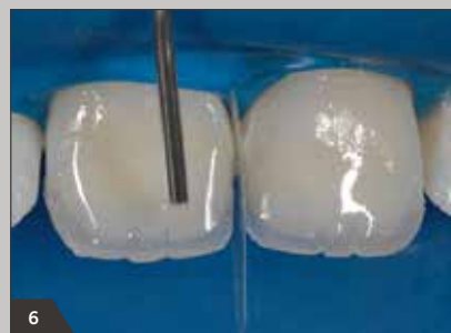
6 Naturähnliche Gestaltung der Mamelons durch leichte Pigmentierung mit Amaris Flow HO