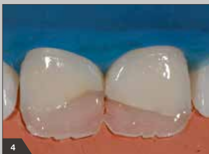
4 Aufbringen von Amaris TL zum Rekonstruieren des palatinalen Schmelzanteils