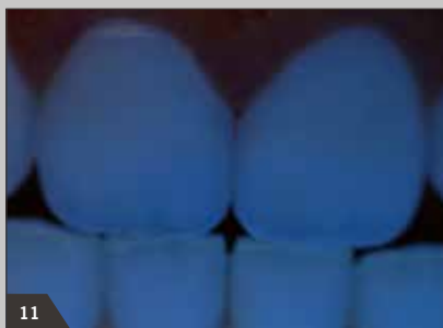
11 Fluoreszenz wie bei natürlichen Zähnen